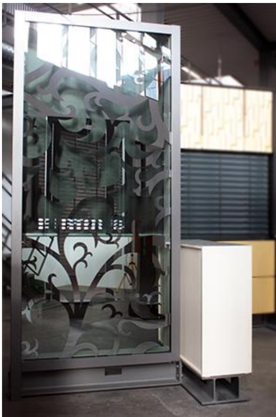
Vorderansicht Front elevation