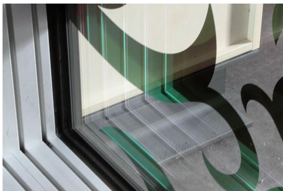
Detail ipachrome design Detail ipacrome design