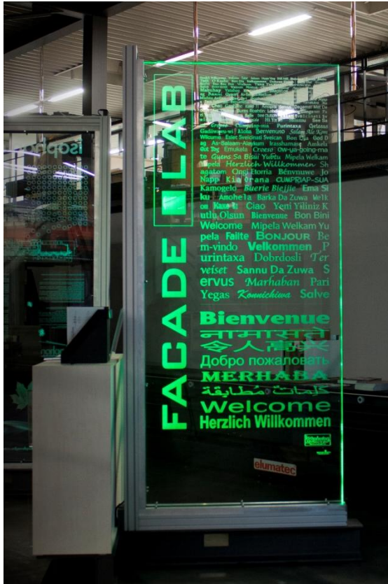
Ansicht zeigt wie fein die gelaserten Strukturen sein können Elevation shows the fineness of lasered structures